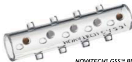
NOVATECH® GSS™ BD

The 1.0 mm thin walls of GSS™ BD stents facilitate the internal movements of the trachea (respiration, ease of the peristaltic movements of the esophagus). This dynamic stent concept allows better mucociliary clearance (depending on mucus viscosity).